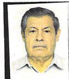
FOTO DEL SOLICITANTE

(DIRECCIÓN DE REGLAMENTOS FISCALIZACIÓN Y CONTROL.)